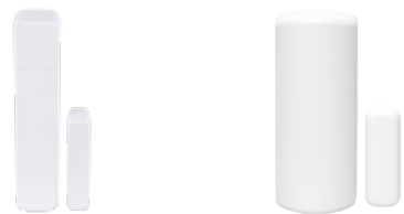
PROSIXCT-EU Contacto para puertas o ventanas