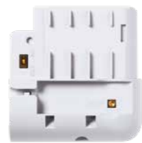
PROLTER-EU Comunicador sin SIM