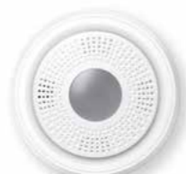
PROSIXSIREN-EU Sirena de interior