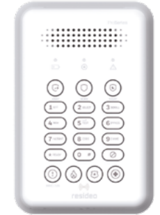
PROSIXLEDKP-EU Teclado LED