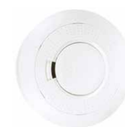
PROSIXSMOKE-EU Detector de humo