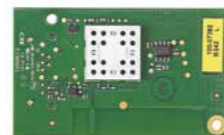
PROWIFIZW-EU Módulo de automatización del hogar