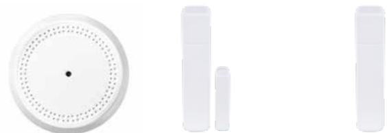
PROSIXGB-EU Detector de rotura de cristales