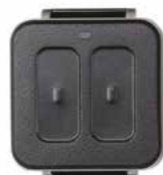
PROSIXPANIC-EU Pulsador de pánico personal