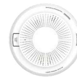
PROSIXCO-EU Detector de monóxido de carbono (CO)