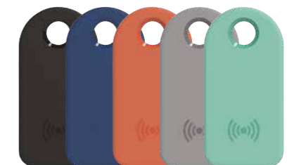
KTAG5 5 llaves inteligentes