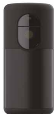
PROOUTMV-EU Visor de movimiento MotionViewer para exteriores