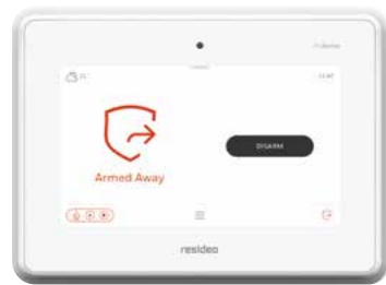
PROAIOPLUS-EU Panel de seguridad todo en uno de 7" con módulo de Wi-Fi®/Z-Wave® (incluido)