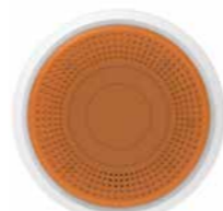
PROSIXSIRENO-EU Sirena exterior