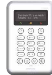
PROSIXLCDKP-EU Teclado LCD