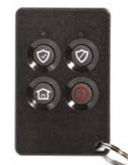
PROSIXFOB-EU Control inalámbrico bidireccional