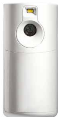
PROINDMV-EU Visor de movimiento MotionViewer para interiores