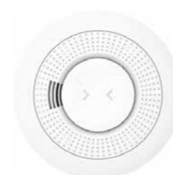
PROSIXSMOKS-EU Detector de humo y sirena