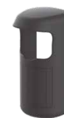
PROOUTMV-CT Protector para PROOUTMV-EU