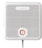
PROAUDIO-EU Altavoz inteligente