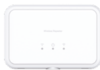
PROSIXRPTR-EU Repetidor inalámbrico