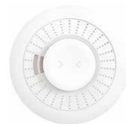
PROSIXHEAT-EU Detector de calor