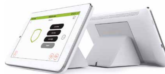
PROA7DM-EU Soporte de escritorio para panel de seguridad todo en uno de 7"