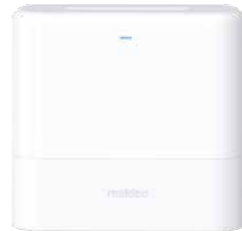
PROBOX-EU Panel de seguridad con Wi-Fi incluido y opciones de LTE y Zigbee