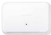
PROSIXC2W-EU Convertidor inalámbrico cableado para SiX