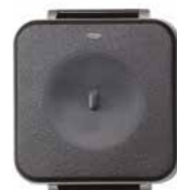
PROSIXMED-EU Pulsador médico personal